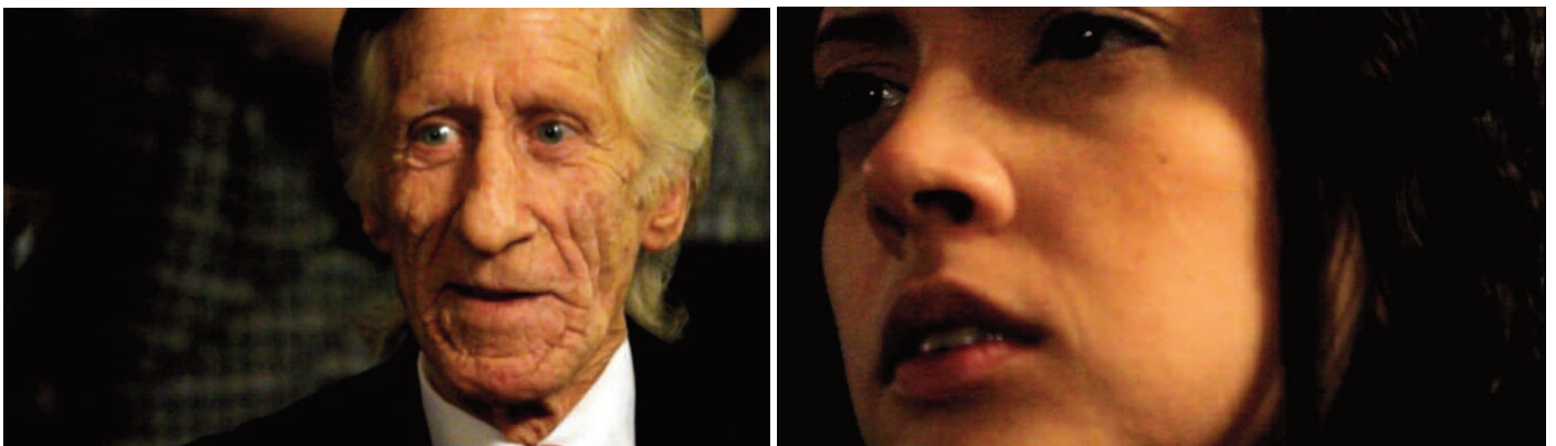
La mirada, installation vidéo, images de la vidéo "La mirada", 2011

La mirada, double projection vidéo en boucle, 2011. Les images de « La mirada » ont été réalisées à la milonga El niño bien, Buenos-Aires, Argentine.